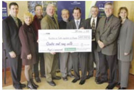
C'est ça le mouvement coopératif !

Les caisses populaires sont aussi présentes à commanditer divers événements culturels et sociaux de notre belle région.