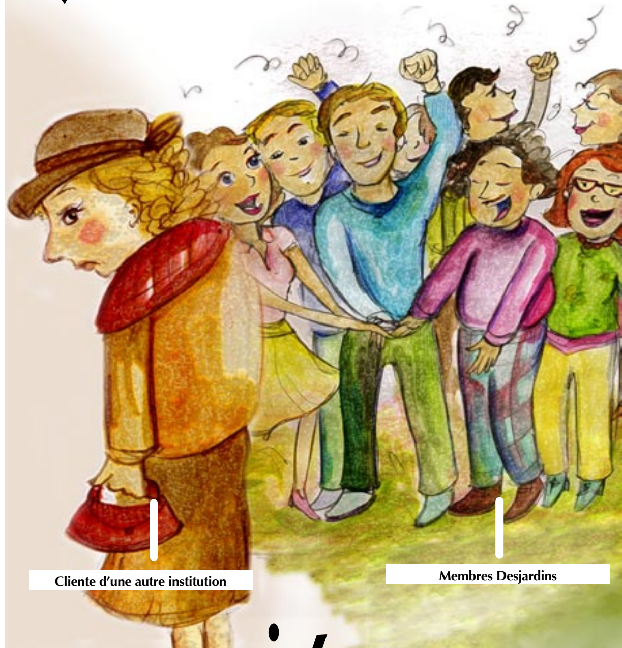
Cliente d'une autre institution